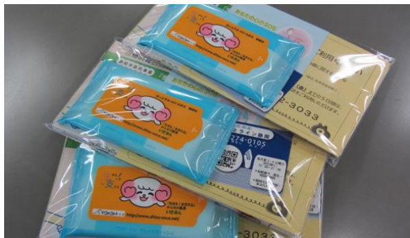
昨年の普及啓発グッズ

9月10日(月)朝の通勤・通学時間帯に合わせて、JR静岡駅にて普及啓発グッズを配布しながら、メンタルヘルスや自殺予防について呼びかけます。