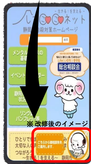
※ 改修後のイメージ