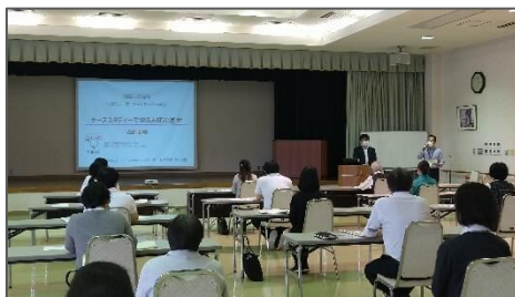
▲介護保険サービス事業所での研修の様子

1月には介護保険サービス事業所の管理職級の職員を対象に、ゲートキーパー研修の第2部応用編となる研修を実施し、講師として各事業所等でゲートキーパー研修を行う際の教え方などを学んでいただきました。今後も、多くの方にゲートキーパーとなっただけできるよう、ゲートキーパー講師の養成を推進していきます。