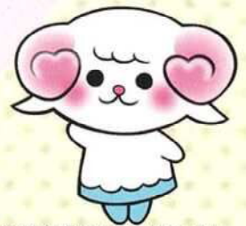
静岡市「生きるを支える」 みんなの隊長 いぎるん

こころの専門家（カウンセラー） 法律問題の専門家（弁護士） 労働問題の専門家（社会保険労務士） が相談に応じます。